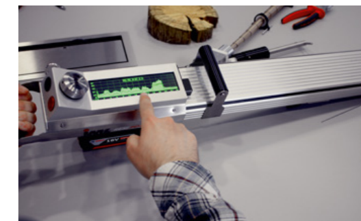
Interpretation der Messkurven